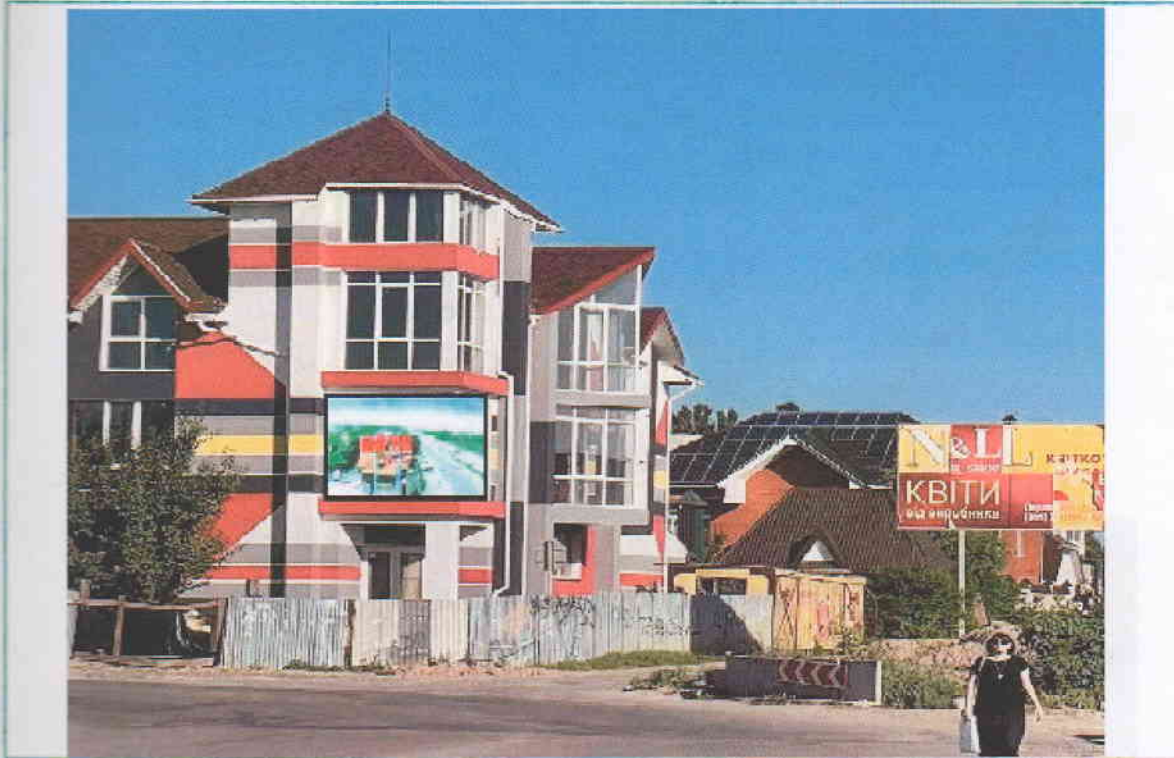
Ескіз з конструктивним рішенням рекламного засобу (робоче креслення рекламоносія)

Фотографічний знімок місця, з фрагментом місцевості, де планується розташування рекламного засобу